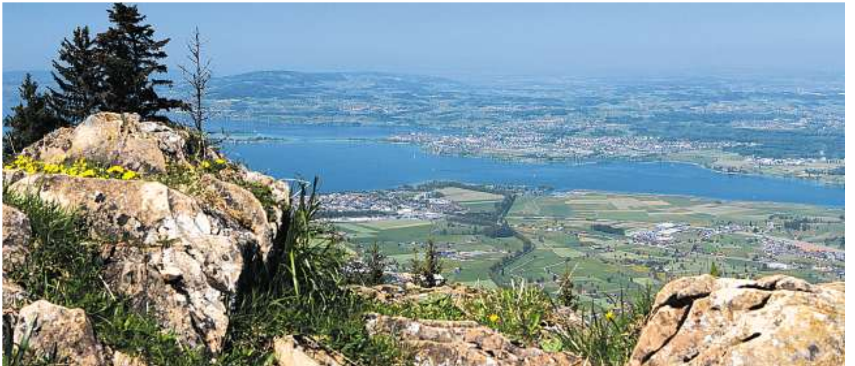
Aussicht vom Stockberg auf den Obersee mit Rapperswil-Jona in der Mitte.

Auf den ersten sechs Kilometern jedoch ist die Orientierung einfach, drei Wie-