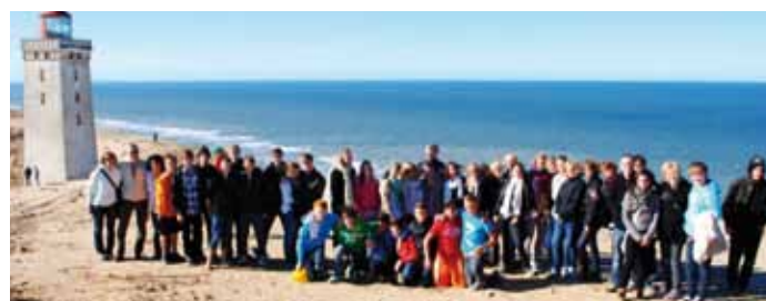
Der Ausflug an die dänische Westküste bildete den Höhepunkt der Reise.

Die warmherzigen Gastfamilien liessen kein Heimweh aufkommen. Am Schlussabend stellten ihnen die Rapperswiler in einer Präsentation ihre Heimatstadt vor. Sie sollten schliesslich aus erster Hand erfahren, wo ihre Kinder letztes Jahr beherbergt