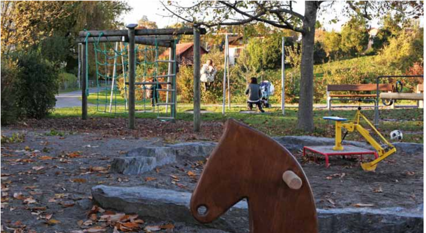
Im Rahmen des Projekts «Kinder im Gleichgewicht» soll der Spielplatz an der Schlüsselstrasse umgestaltet werden.

Die Bürgerversammlung der Stadt Rapperswil-Jona wird am 9. Dezember im Rahmen des Budgets auch über Vorhaben des Ressorts Bildung und Familie abstimmen. Auf der Traktandenliste stehen unter anderem Neugestaltungen des Spielplatzes Schlüsselstrasse und des Pausenplatzes Burgerau.