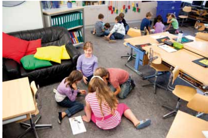
Schüler sollen sich bewusst sein, wie sich ihr Benehmen auf Mitschüler auswirkt.

Die Schüler sollen sich, vor allem in Konfliktsituationen, in gemeinsamen Gesprächen mit den unterschiedlichen Wertvorstellungen auseinandersetzen. Sie müssen sich bewusst werden, wie sich ihr Benehmen auf die Mitschüler auswirkt. Was heisst es zum Beispiel für Betroffene, ausgegrenzt zu werden. Oder wie könnte man einen Konflikt gewaltfrei austragen?