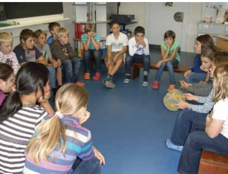
Der Klassenrat arbeitet auf der Beziehungsebene, alle Beteiligten treffen sich als gleichberechtigte Partner.